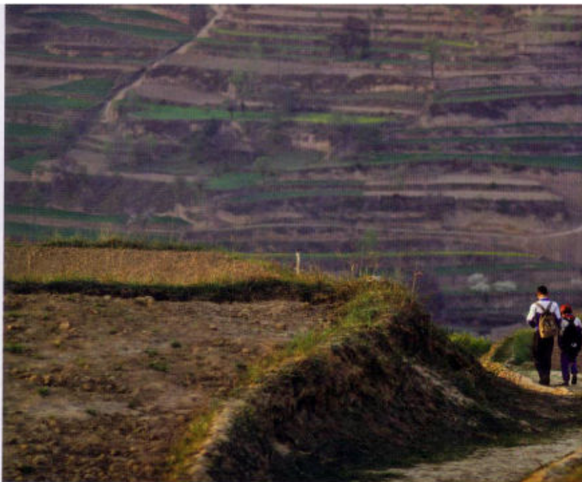
Depuis 2004, dans les zones rurales les plus pauvres, l'Etat a éliminé les frais de scolarité pour les 9 années d'enseignement obligatoires mais la

Depuis 1999, l'association « les enfants de Madaifu » aide les enfants orphelins dans les villages situés dans les régions les plus reculées de la Chine. Dans les provinces du Shaanxi, du Gansu et du Hubei, une centaine d'enfants a ainsi pu être scolarisé grâce à l'association. Cette dernière paie les frais liés aux études et à la vie quotidienne et aide les écoles rurales qui manquent cruellement d'équipements. Aujourd'hui, la scolarité étant devenue gratuite dans la plupart des campagnes pauvres, « les enfants de Madaifu » s'oriente désormais vers la promotion de solutions à long terme : création de dortoirs pour les enfants des villages les plus reculés, équipement des écoles et prise en charge plus large comprenant les frais médicaux. Depuis sa création par Marcel Roux, un médecin français qui a vécu pendant plus de dix ans en Chine, l'association « Datong » a été rebaptisée « les enfants de Madaifu » en 2003. Elle a réussi à mobiliser l'attention des expatriés français et a également reçu le soutien des bureaux locaux des Affaires Civiles, qui ont reconnu