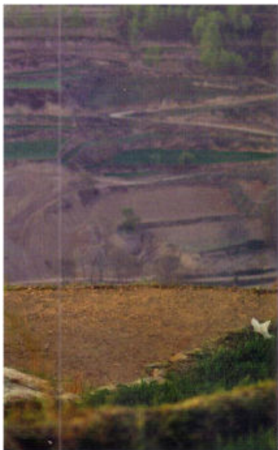
te pour mettre les enfants au travail.

particuliers et les entreprises sont les sources principales de financement, mais l'association a également bénéficié pendant plusieurs années d'une subvention de l'ambassade de France en Chine. Si la subvention de l'État n'a toujours pas été renouvelée, « les enfants de Madaifu » dispose aussi depuis deux ans du soutien d'une troupe de théâtre (théâtre des lanternes) qui organise à Pékin des spectacles dont les recettes lui sont entièrement reversées. Dernière opération de soutien : l'exposition du photographe Gilles Sabrié, qui a fixé sur la pellicule le minois des jeunes orphelins du Gansu et du Shaanxi. La vente de ces clichés est venu compléter le budget de l'association. ■